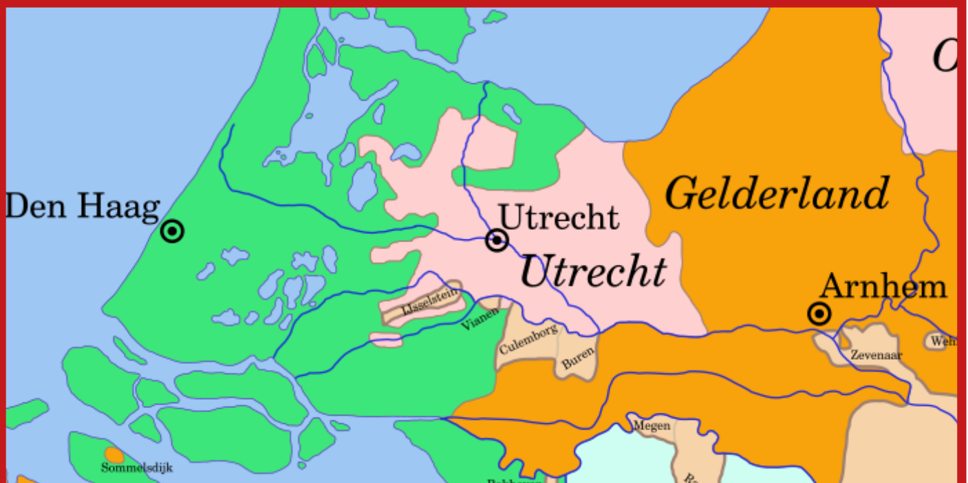
Baronie van IJsselstein

500 jaar lang vormde de Baronie een zelfstandig gebied in de 17 Provinciën en de latere Republiek. Het bleek een ijzersterk verband. Vanaf de middeleeuwen voerde IJsselstein een eigen koers. IJsselstein had als vrijstad eigen wetten en gebruiken, los van Stichtse of Hollandse wetgeving. Het Land van IJsselstein ofwel Baronie van IJsselstein was een enclave in het Stichtse gebied op de grens van Holland. Deze enclave was ontstaan vanuit IJsselstein met een ontginning van de woeste gronden: een wetering die tot aan de Vlist liep, zo'n 20 kilometer in lengte en met 'cope'verkaveling in de dwarsrichtingen. Dit was het achterland van IJsselstein, landgebied dat bij IJsselstein behoorde. De kasteelheren van weleer vochten in verschillende oorlogen voor een sterke autonomie van hun stad en deze landgoederen. Binnen de grenzen van IJsselstein waren de bewoners, de 'poorters', gevrijwaard van het landelijk gerecht.